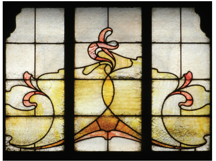
▲ Vitrail du hall d'entrée, 2020.